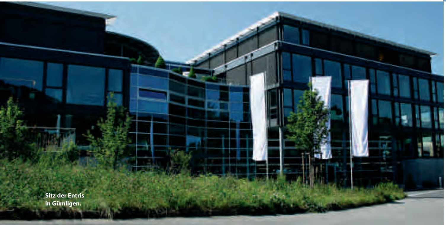
Sitz der Entris in Gümligen.

Entris Audit erfüllt die Anforderungen des Berufsstandes, der Eidgenössischen Finanzmarktaufsicht (Finma) und der Revisionsaufsichtsbehörde. Unsere breite Erfahrung erlaubt den Zugriff auf bewährte Tools und Methoden, die lange erprobt und ausgereift sind, aber dennoch einem stetigen Aktualisierungsprozess unterliegen. Dies führt zu effizienten Prüfungen, die es uns erlauben, immer den Fokus über das gesamte geprüfte Unternehmen zu wahren.