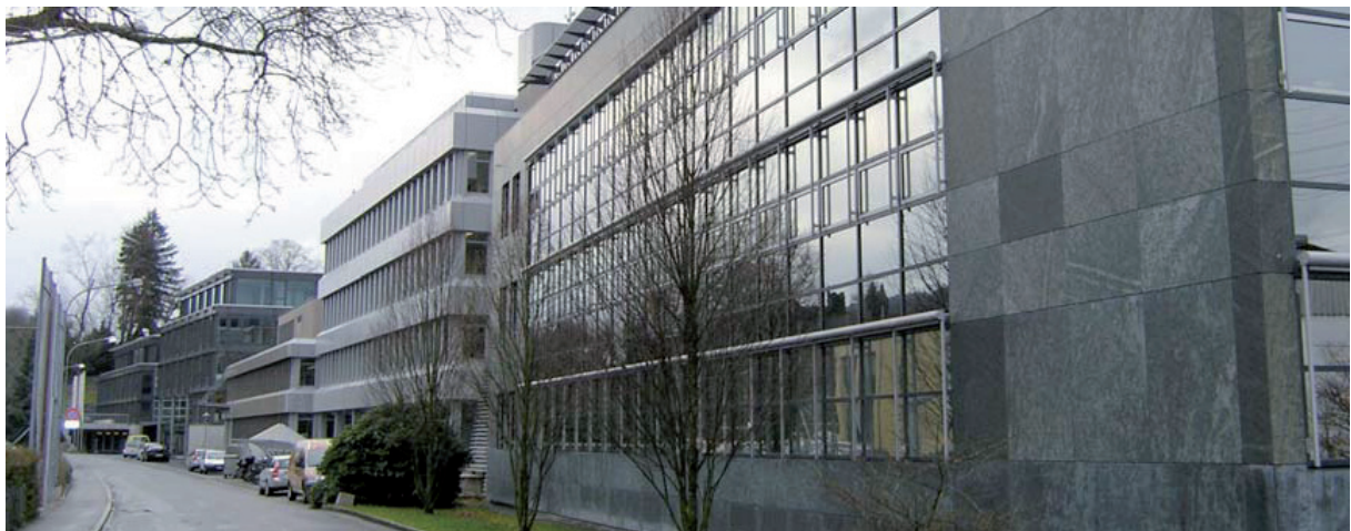
Mattenstrasse 8, Gümligen